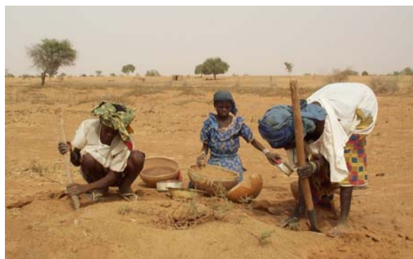
Collecting Wild Grains from an Anthill: Dangana, 14 th May, 2006

Tailoring the services of food security stocks to the needs of specific beneficiaries leads to questions about the longer term development of such structures. The logic of running them according to unrewarded voluntary principles has already been questioned at Dakoro (COWI, 2004: 68). Linking these structures to other activities (e.g. MMD) or grouping them into wider structures (e.g. the GGA networks currently being put in place in Diffa) is likely to further strain voluntarism. Any process of professionalisation will require accompanying measures to insure that the needs of the poorest remain central. A further issue for consideration concerns the membership base. Under current community management systems, residency is an essential criteria, but there remain unexplored possibilities to extend food security stock services to a wider non-resident population e.g. to women who have married outside the village and to transhumant herders.